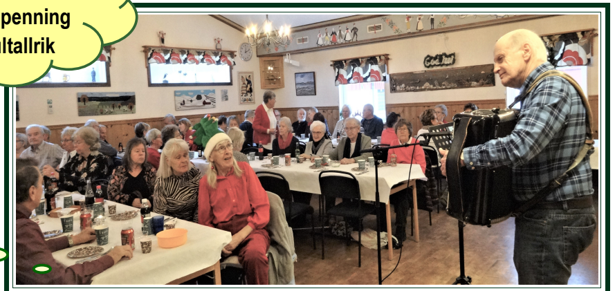
Julsånger till Lennarts handklaver