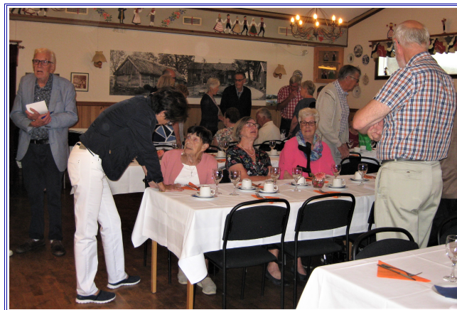
Vårt "gästbord" håller på att fyllas