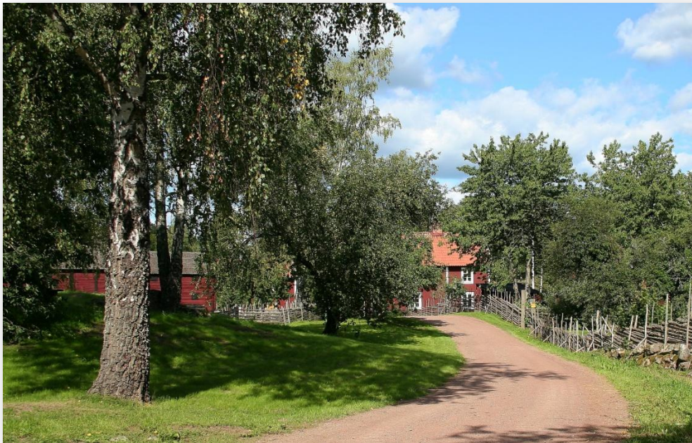
Stensjö by med dess bevarade miljö från bondesamhället

Därmed var grundstrukturen i den allmänna pensionsförsäkringen utformad.