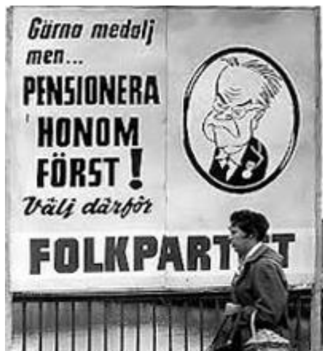
Valaffischer från nyvalet

Källor: Försäkringskassans socialförsäkringsrapport Avsnittet om ATP: Robert Björkenwall